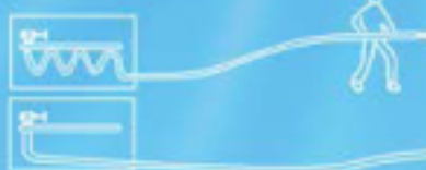
2. Pull off the hose completely