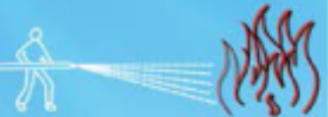
3. Point towards the fire.

In line with our policy of continuous product improvement, we reserve the right to modify specifications without prior notice.