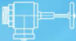
1. Open the valve